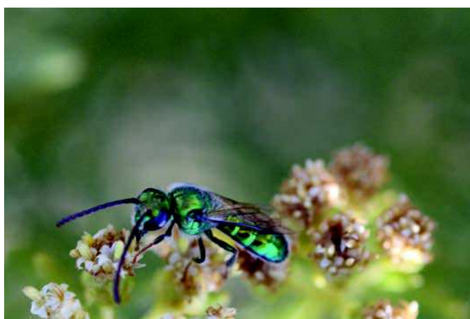
Figura 16: C. chloris en Baccharis sp. en Villa Batuco. Región del Maule. (Fotografía V. Monzón).

Descripción de la especie: Es una abeja pequeña, de color verde metálico, con escasa pilosidad blanquecina corta.