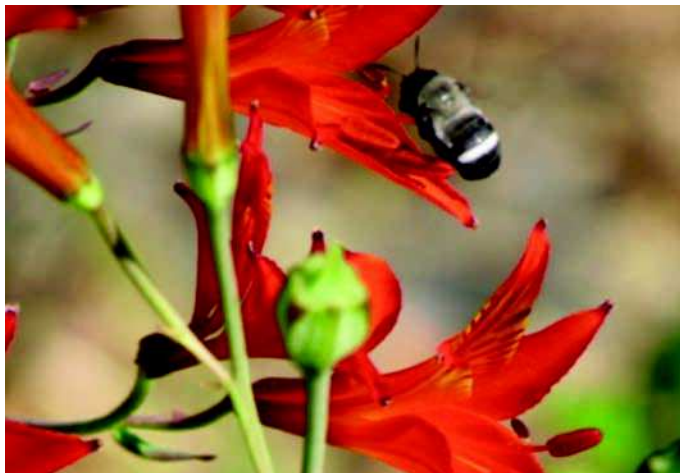
Figura 10: S. melanura en Alstroemeria ligtu ssp. simsii en camino Penciahue - Curepto. Km. 40. Región del Maule.

Descripción de la especie: Es una abeja de tamaño mediano, presentan pilosidad negra, blanquecina en la parte dorsal del tórax y en la parte proximal de metasoma. Las hembras presentan una banda transversal de pelos blancos en la mitad del metasoma.