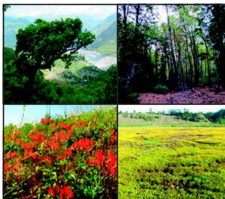
Figura 1: Lugares de observaciones de abejas nativas de la Región del Maule. A: Armerillo, B: Altos del Lircay, C: Camino Pencahue-Curepto KM 20 y Km 40 y D: Putú.

En la Región del Maule, hotpost de biodiversidad, existen muchas especies de abejas y las de esta guía son una parte de ellas. Hemos recorrido la región buscando zonas que aun conserven la flora y sus abejas nativas, así hemos identificado zonas en Putú, Altos del Lircay, Armerillo, Batuco, varios lugares en el camino entre Pencahue y Curepto, y Parral, entre otros (Ver Figura 1).