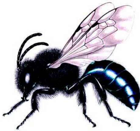
Figura 7: C. seminitidus , detalle de su morfología y pilosidad. (Dibujo C. Tobar).

Estado de conservación: En grandes cantidades en zonas costeras (Putú) y en la Precordillera (2.000 msnm). Por ser zonas protegidas sus poblaciones son relativamente estables (com. pers.).