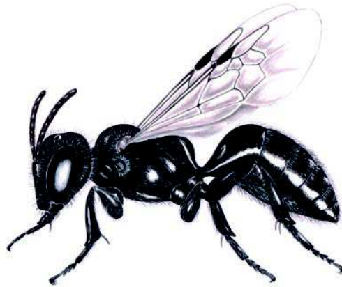
Figura 13: M. gayatina , detalle de su morfología y pilosidad (Dibujo C. Tobar).

Estado de conservación: Alta presencia en las zonas de estudio.