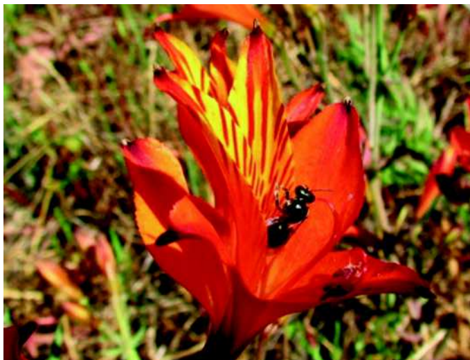
Figura 12: M. gayatina en Alstroemeria ligtu ssp. simsii en camino Penciahue-Curepto. Km. 40. Región del Maule.

Descripción de la especie: Es una abeja pequeña, de color negro, con pilosidad blanca corta.