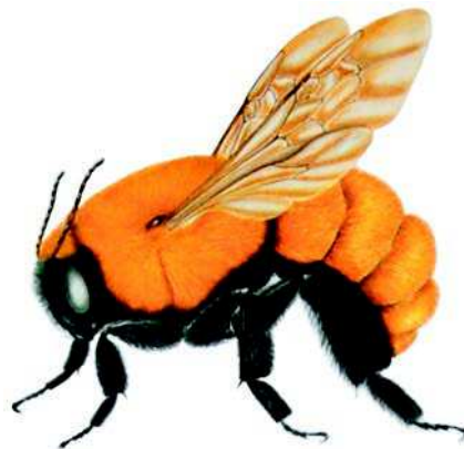
Figura 3: Hembra de B. dahlbomii , detalle de su morfología y pilosidad. (Dibujo C. Tobar).

Estado de conservación: En peligro, esta especie ha disminuido drásticamente en la zona central de Chile, debido a la introducción de Bombus exóticos, los cuales les han transmitido patógenos (Montalva, 2012). Se encuentran actualmente poblaciones sanas en la Isla grande de Chiloé y ha comenzado a verse en diferentes zonas de la región del Maule (Observación personal).