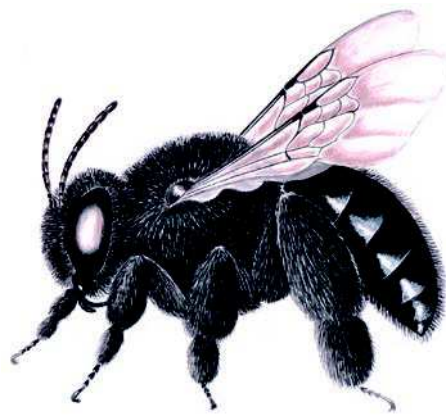
Figura 5: Hembra de C. nigerrima , detalle de su morfología y pilosidad. (Dibujo C. Tobar)

Estado de conservación: Se han visto numerosos individuos en las tres zonas de observación. Aparentemente sin problemas de conservación.