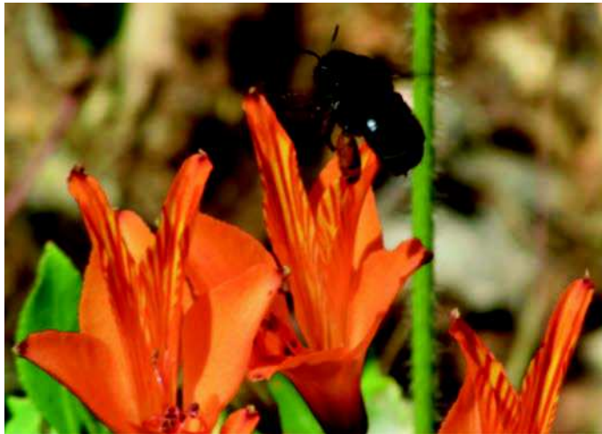
Figura 4: Hembra de C. nigerrima en Alstroemeria ligtu ssp. simsii en camino Penuhue-Curepto. Km. 40. Región del Maule.

Descripción de la especie: Es una abeja de gran tamaño. Con cuerpo y pilosidad de color negro. Los machos presentan parte de la cara (clípeo) de color amarillo. Las hembras tienen grandes escopas en patas posteriores para la colecta de polen.