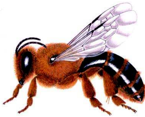
Figura 15: C. Occidentalis , detalle de su morfología y pilosidad (Dibujo C. Tobar).

Estado de conservación: Alta presencia en el mes de octubre en zonas de estudio.