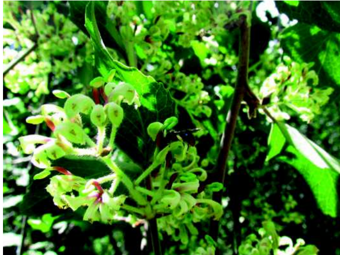
Figura 8: M. postica en Lomatia hirsuta (radal) en Altos del Lircay, Región del Maule.

Descripción de la especie: Es una abeja pequeña, de color negro, destacándose una coloración roja en los últimos segmentos del abdomen.