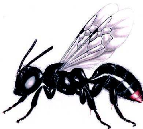
Figura 9: M. postica , detalle de su morfología y coloración (Dibujo C. Tobar).

Estado de conservación: Presente de manera abundante en zonas de estudio.