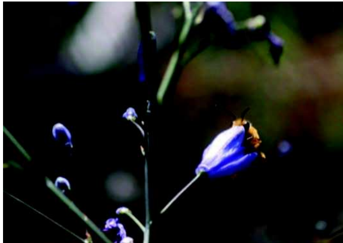
Figura 14: C. occidentalis en Pasithea coerulea (Azulillo) en Km. 20, camino Penciahue-Curepto. Región del Maule.

Descripción de la especie: Es una abeja grande, de pilosidad anaranjada, con antenas negras y escopas bien desarrolladas.