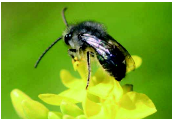
Figura 6: C. seminitidus en Brassica campestris (Yuyo) en Putú. Región del Maule.

Descripción de la especie: Es una abeja de tamaño medio. Con tórax con pilosidad gris blanquecina. Los machos presentan la cara con la misma pilosidad. Abdomen con color verde azulado metálico y brillante.