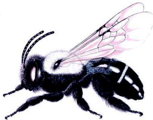
Figura 11: S. melanura , detalle de su morfología y pilosidad (Dibujo C. Tobar).

Estado de conservación: Sin problemas de conservación en los lugares estudiados debido al gran número de ellos.